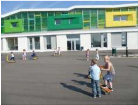
L'école primaire intercommunale « Les Vergers » de Kriegsheim-Rottelsheim

« Nous avons opté pour l'installation d'une pompe à chaleur géothermique car nous souhaitions choisir une énergie propre, peu onéreuse, facile d'entretien. La solution retenue nous convient tout à fait car les sondes ont a priori une longue durée de vie (50 ans environ) et demandent peu d'entretien. L'investissement financier reste conséquent et la mobilisation du Fonds Chaleur géré par l'ADEME a été un élément majeur dans notre décision finale ».